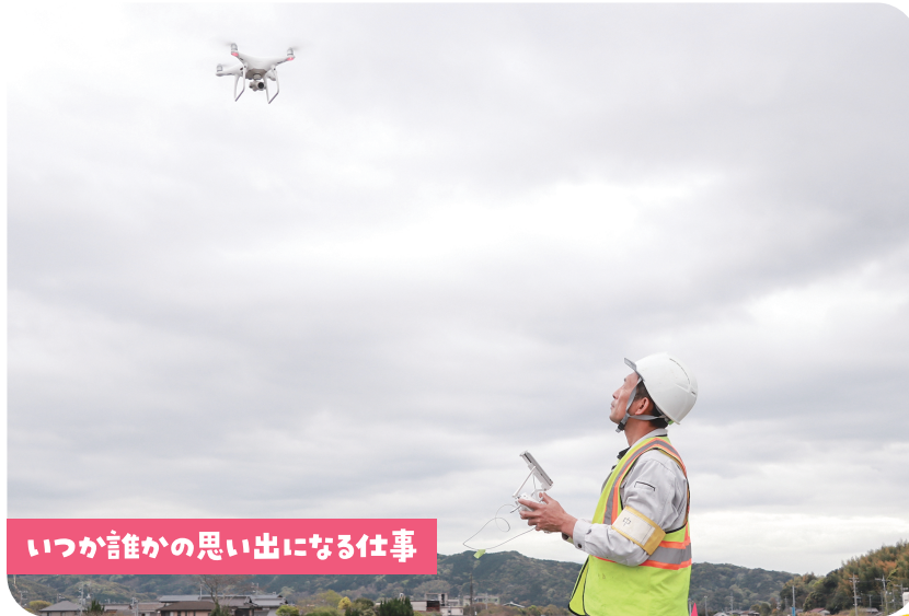
いつか誰かの思い出になる仕事